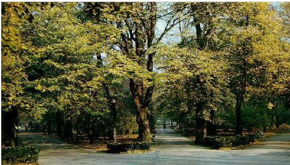
Foto 2.2. Parcul Ștefan cel Mare [9, p. 85] sau [elaborat de autor]